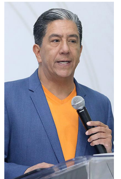
ARRANQUE. Ya se revisan aspirantes ciudadanos.