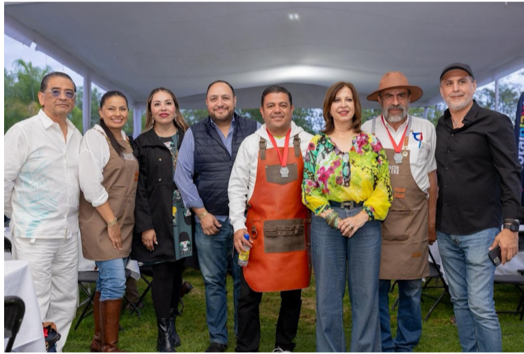
EXPERIENCIA. El evento reunió a aficionados y expertos de la cocina parrillera.