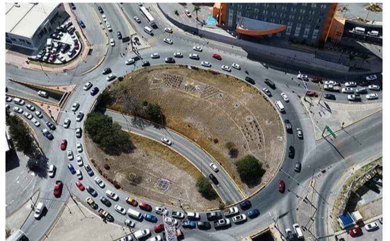
CONFLICTIVO. Brindaría soluciones de movilidad a ese sector de la ciudad.

El alcalde detalló que la idea es dar continuidad al flujo vehicular de Salvador Nava hacia la carretera a Guadalajara mediante un deprimido