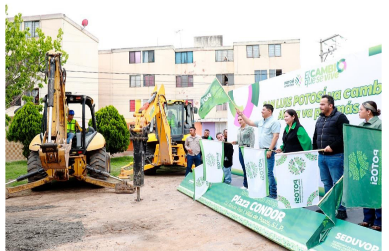
PROYECTO. Comenzó la rehabilitación integral de Plaza Cóndor.

Destacó que esta nueva obra beneficiará a más de 2 mil 800 personas y abarcará una superficie superior a los 22 mil 500 metros cuadrados, donde se desarrollará un