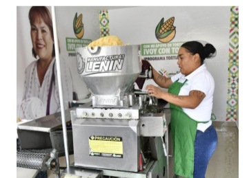
BANDERAZO. La tortilla a bajo costo comenzó en la col. Simón Díaz.

Comentó que el kilogramo de tortilla tendrá un costo de 14