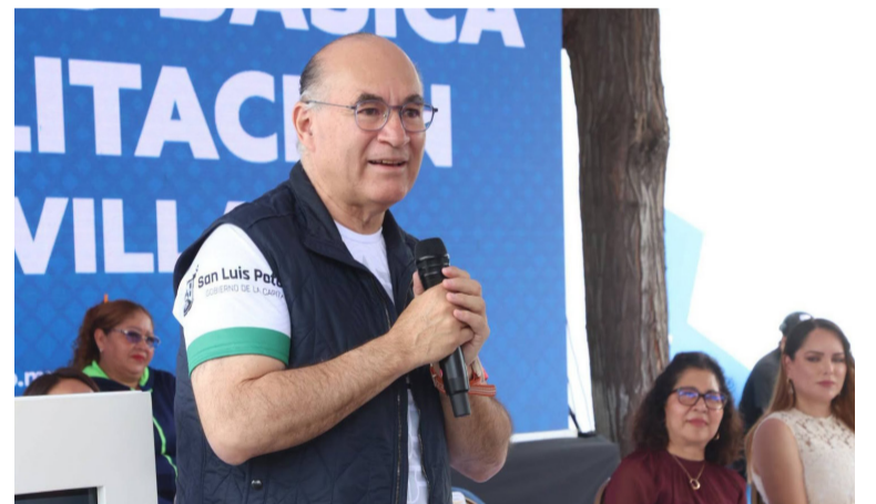
RESTRICCIONES. Se respetarán las áreas protegidas con valor ecológico.

Añadió que la ciudad debe mantener un ritmo de crecimiento ordenado hacia zonas posibles y todavía subdesarrolladas, como Escalerillas,