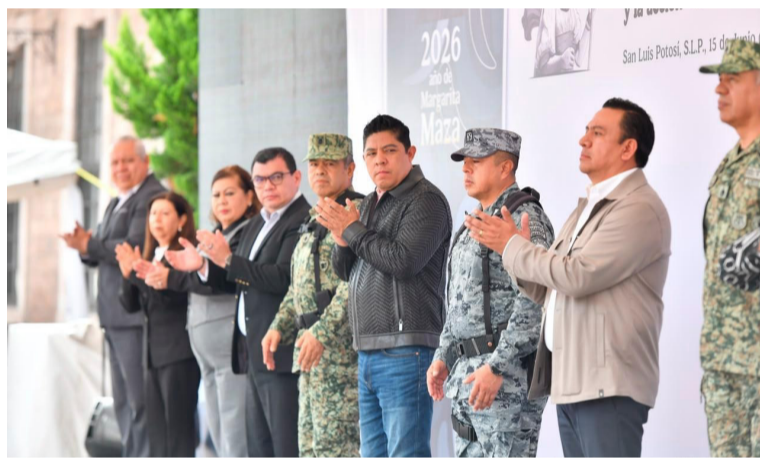
REGIONAL. Se instalarán módulos de recepción en cada municipio.

Durante el evento, el gobernador destacó que San Luis Potosí se