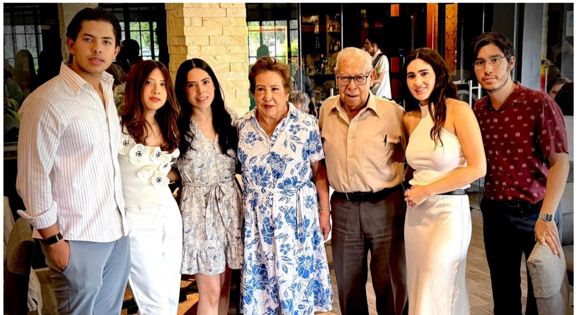
CONVIVENCIA. Junto con sus nietos, disfrutó una tarde de reencuentros y buenos deseos.