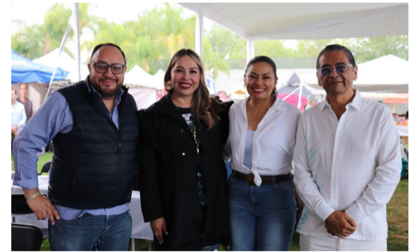
CELEBRACIÓN. Fue un encuentro de sabor y amistad.