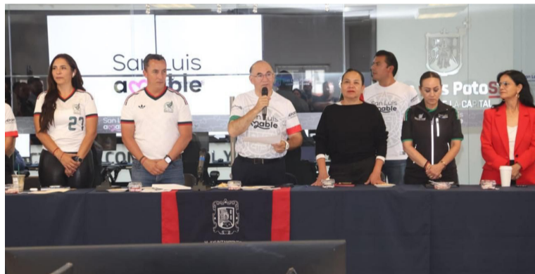
RECURSOS. Permitirán mejor abasto e infraestructura en la ciudad.