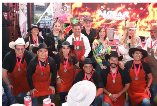
APRENDIZAJE. Dieron conocer nuevas técnicas culinarias.