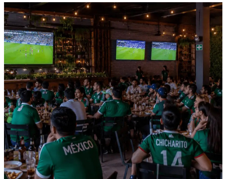
PLAN. Ofrecen promociones, descuentos y ofertas para atraer clientes.

Explicó que, en muchos casos, los consumidores continúan acudiendo al comercio de barrio por el trato personalizado y por las facilidades que ahí encuentran, como la posibilidad de realizar compras pequeñas sin necesidad de desplazarse largas distancias.