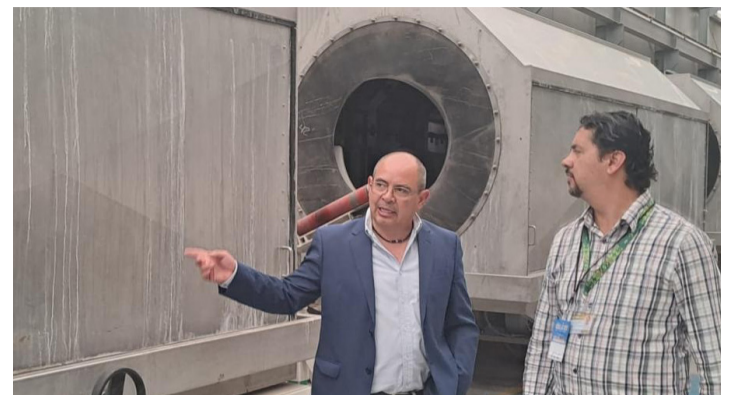
ALTERNATIVA. Los nuevos materiales son más resistentes a la presión.

con organismos empresariales y aliados estratégicos representa el cambio que se vive y se siente mediante una mayor proyección internacional, más oportunidades de negocio para las empresas locales y mejores condiciones para la generación de empleos y el crecimiento económico.