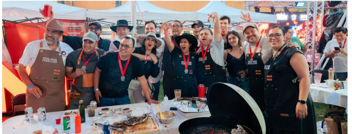
TALENTO. Los participantes demostraron creatividad y pasión en cada una de sus preparaciones.

La celebración también incluyó el tradicional concurso parrillero, en el que los competidores pusieron a prueba su creatividad y habilidades frente al fuego, elaborando sus mejores recetas en un ambiente de sana competencia y camaradería.