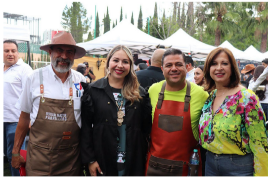
CONVIVENCIA. Familias y amigos disfrutaron la experiencia.