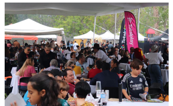
SABOR. Los aromas de brasas y platillos invadieron el lugar.