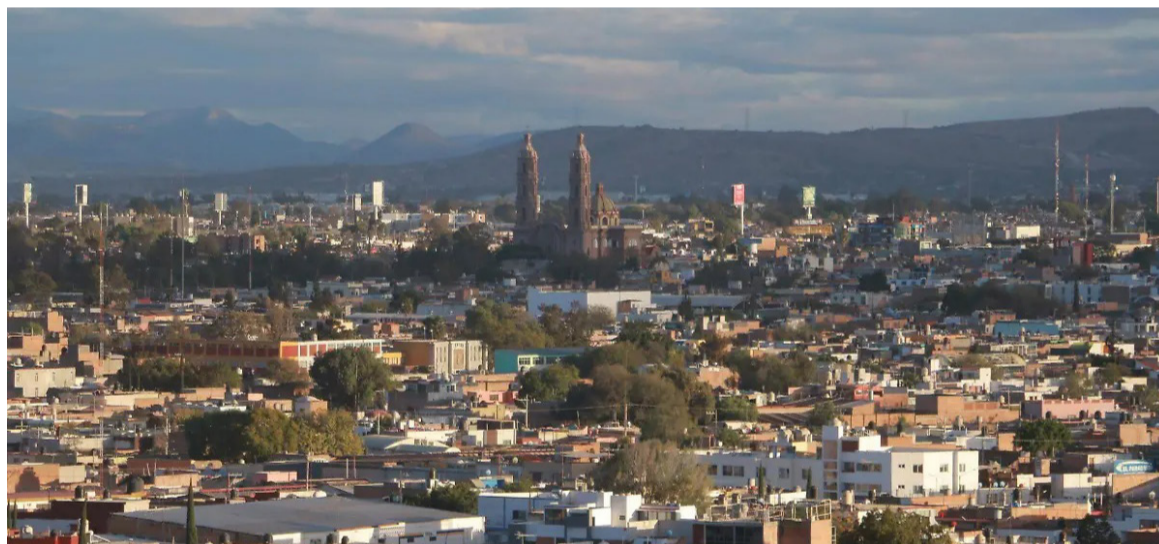
CAPITAL EN ASCENSO. El IMCO la considera como una de las zonas urbanas con mayor desarrollo del país.

El IMCO la ubica en el noveno lugar nacional tras avanzar tres posiciones respecto a 2025.