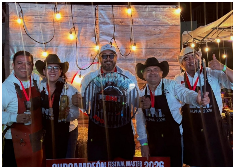
TRADICIÓN. El concurso parrillero volvió a ser uno de los momentos más esperados.