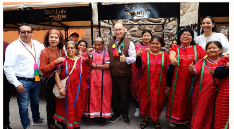
IMAGEN URBANA. Se unificaron los puestos de los vendedores del callejón.