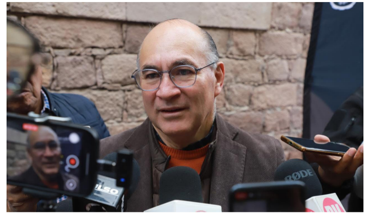
EFFECTIVIDAD. Atribuye los resultados a la estrategia de seguridad.

Asimismo, el Consejo autorizó la pavimentación con carpeta asfáltica de la calle Xacube, en la colonia Los Magueyes, obra que contempla una intervención integral con trabajos de demolición, rehabilitación de redes hidráulicas y sanitarias, terracerías, pavimentos, banquetas, guarniciones y señalamiento, para mejorar la movilidad y las condiciones urbanas.