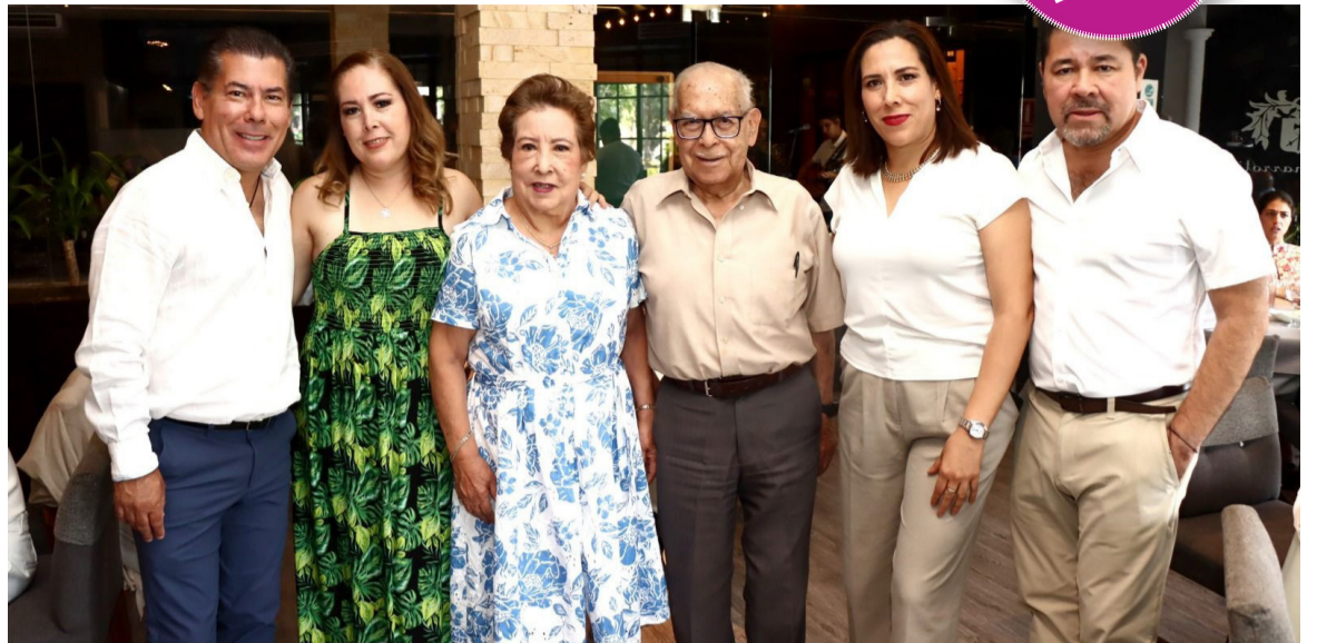
CELEBRACIÓN. Familiares y amigos compartieron una agradable velada en honor de la cumpleañera.