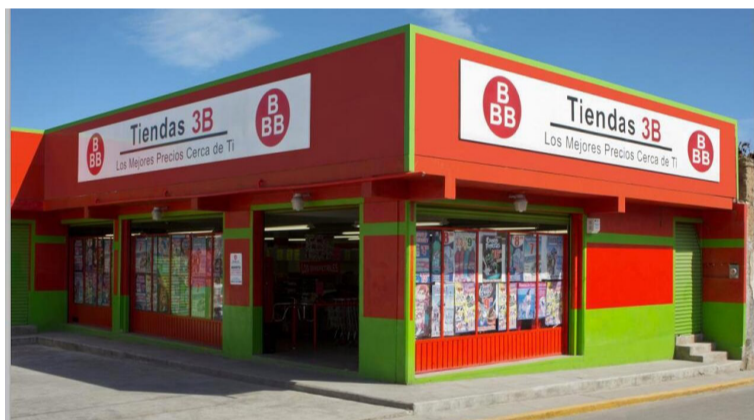
RETO. Tiendas de barrio se enfrentan a competencias con grandes cadenas.