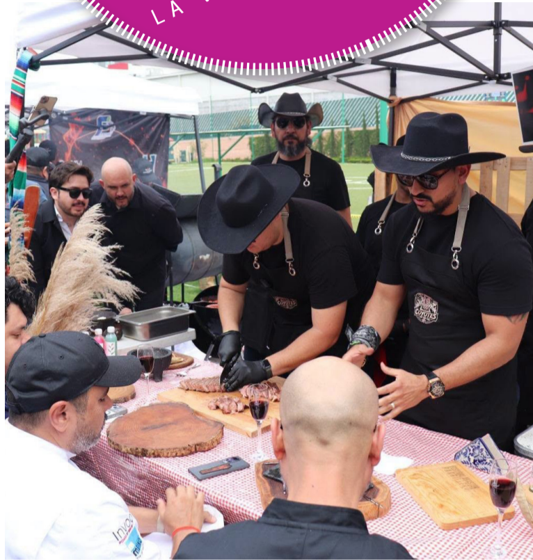
PARRILLA. Los competidores elaboraron sus mejores recetas en el concurso.