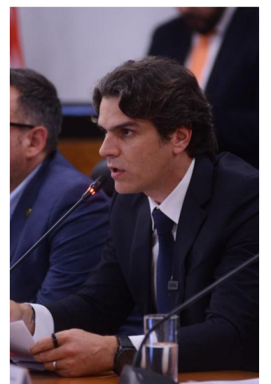
PROYECTO. Busca aprovechar reglas de contenido regional del T-MEC.

El legislador federal explicó que el objetivo del parque tecnológico es vincular a estudiantes e ingenieros egresados de la UASLP, institutos tecnológicos y universidades politécnicas con proyectos desarrollados por empresas instaladas en los parques industriales de la entidad.