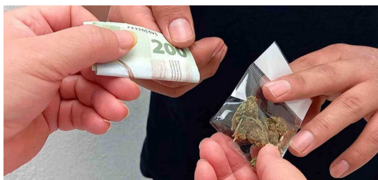
DESALENTADOR. La entidad registró la peor tasa nacional de este delito.

En el caso potosino, el mayor peso recae en la venta de droga