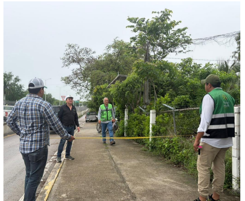
VISITA. Personal de la SCT trabaja en los municipios involucrados.

La Red Metro Riviera Huasteca ofrecerá una alternativa de transporte moderna, eficiente y gratuita