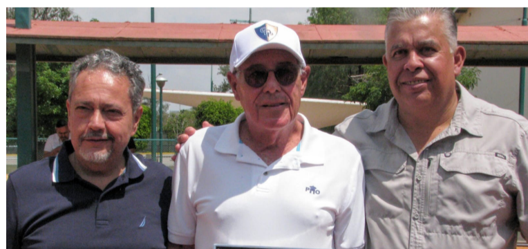
LEGADO. Su ejemplo inspira a nuevas generaciones.