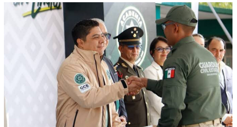
GARANTÍA. Municipios podrían ser multados por incumplimiento.

El decreto establece que los tabuladores salariales deberán asegurar, como mínimo, una remuneración