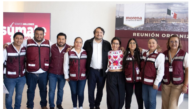
ENCUENTRO. Participaron coordinadores territoriales del partido.

Esquivel Veloz destacó que, a nivel nacional, la campaña de afiliación ha superado la meta prevista por más de dos millones de registros, lo que, afirmó, refleja el crecimiento y consolidación del movimiento.