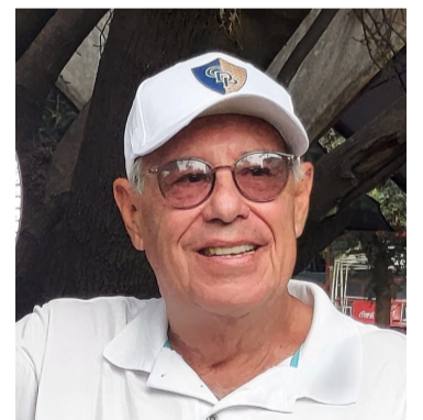
RECONOCIMIENTO. Destacan su legado en la comunidad tenística.