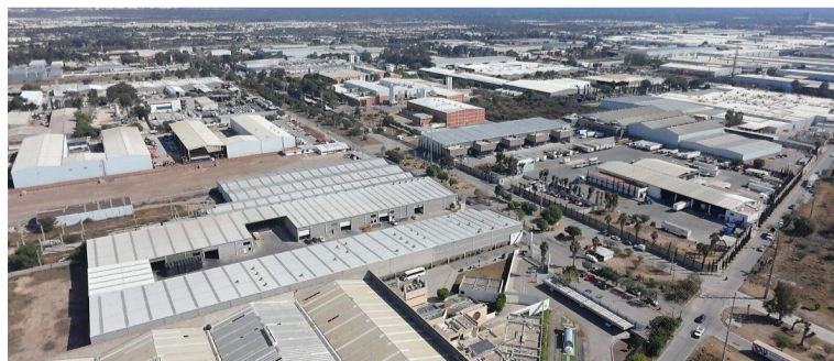
PLANES. Se busca detonar inversión y empleo en la zona.

El proyecto inaugurado en Tlaxcala contempla una inversión aproximada de 540 millones de dólares en una superficie de 53 hectáreas, con la expectativa de generar entre cinco mil y seis mil empleos directos e indirectos. El de SLP se