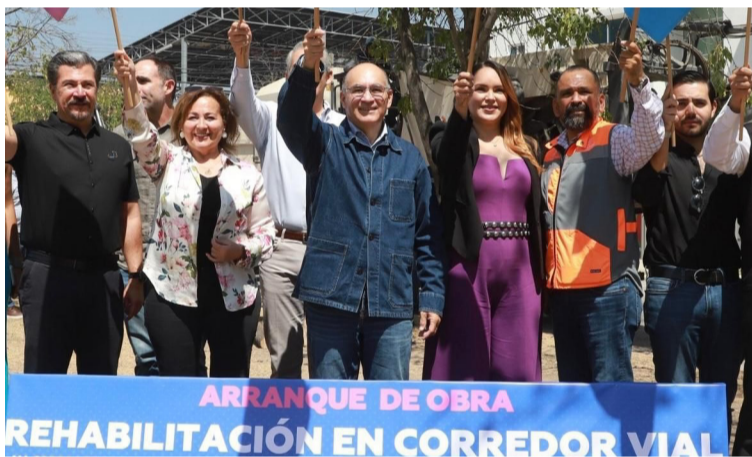
OBRAS. Se realiza bacheo, reencarpetado, limpieza, poda y renovación de alumbrado.

Con estas acciones se da respuesta a las peticiones de los vecinos de la zona, quienes señalaron que desde hace más de 30 años no se daba mantenimiento a estas vialidades, por lo que se encontraban muy deterioradas y dificultaban la movilidad en una zona de muy alto flujo vehicular.