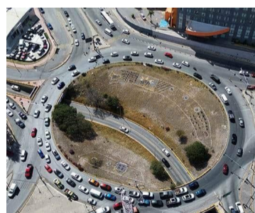
PRIORIDAD. Uno de ellos es la salida a Guadalajara, al poniente de la ciudad.

Por otro lado, comentó que, con la llegada de una nuevo mega CeDis al parque industrial Logistik, se detonará la creación de empleos en beneficio de las y los potosinos, no solo de la zona metropolitana, sino de los