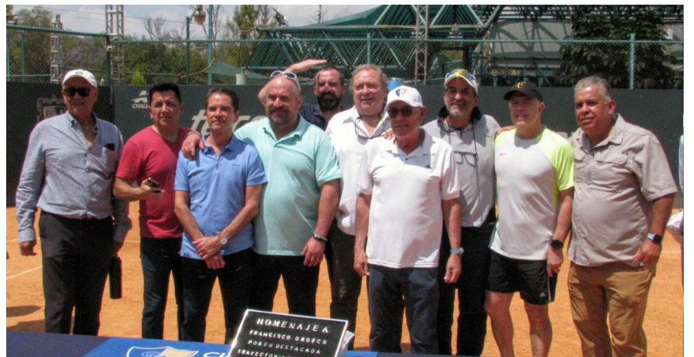
EMOTIVO. El acto reunió a amigos y familiares.