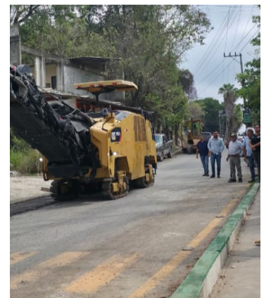
TRABAJOS. Se contempla un tramo de más de 3 kilómetros

Francisco Reyes Novelo, informó que la intervención contempla un tramo de más de 3 kilómetros desde el entronque con la carretera federal 85 hasta la cabecera municipal, donde se realizan labores de bacheo profundo, limpieza de cunetas, construcción de estructuras de concreto para drenaje pluvial, pavimentación integral, así como la instalación de señalamiento y dispositivos