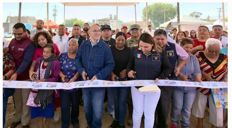
ATENCIÓN. Combaten las causas que originan la violencia.