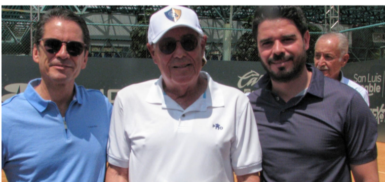
COMUNIDAD. Socios y jugadores acompañaron el evento.