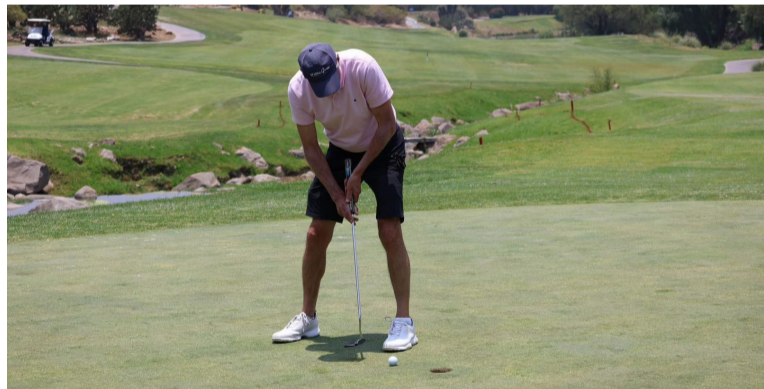
EXPECTATIVA. El torneo reunirá a más de cinco mil asistentes.