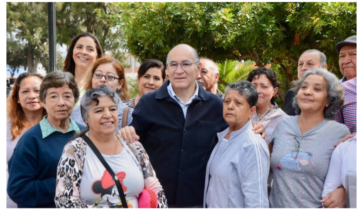
TRAMO. Se intervino la red en intersección de Pedro Vallejo y Juan Zarco.

Las obras iniciadas este jueves incluyen bacheo mayor, 6 mil metros cuadrados de fresado en superficie de rodamiento y 6 mil metros de carpeta asfáltica, así como la nivelación de cajas de válvulas y pozos de visita.