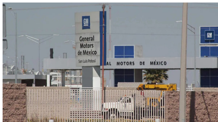
ACUERDOS. Se promovió diálogo entre sindicato y directivos.

La resolución del diferendo laboral evitó un paro en una de las plantas