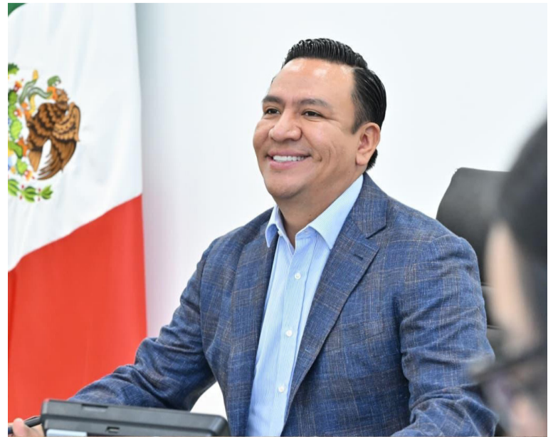
PACTO. Garantizarán condiciones para unas elecciones con tranquilidad.

El titular de la SGG afirmó que el objetivo es ser muy preventivos y garantizar que, antes, durante y después del proceso electoral, prevalezca la gobernabilidad completa, sin estridencias que perjudiquen el desarrollo de la democracia.