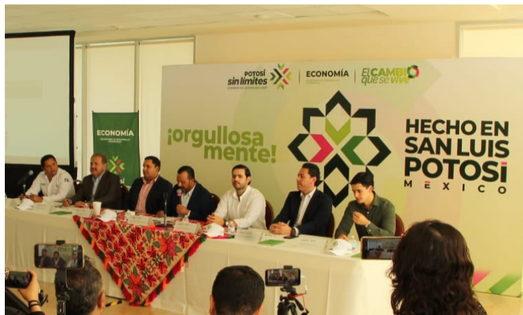
OBJETIVO. Facilita el posicionamiento de marcas potosinas.