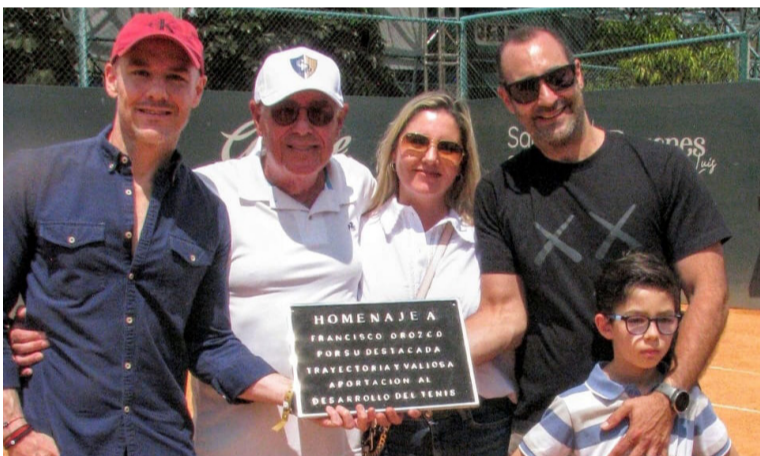
ESCENARIO. La ceremonia se realizó en la Cancha 4 de tenis.