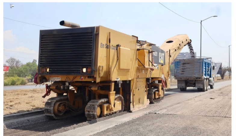
SEGUNDA ETAPA. El nuevo tramo estaría listo este mismo año.