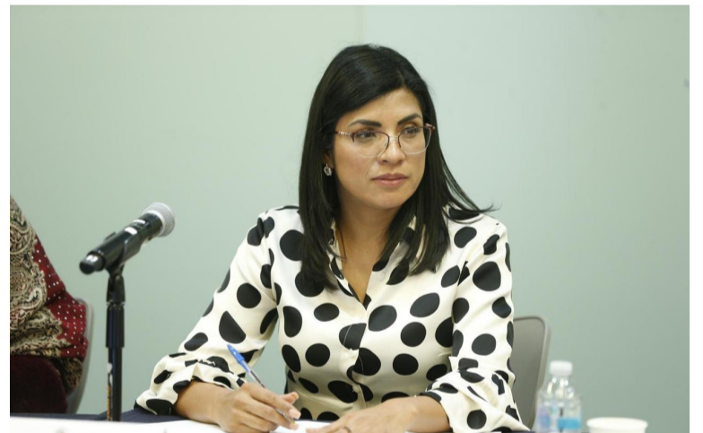
OBJETIVO. Proyecta sumar perfiles ciudadanos en todo el estado.

Rodríguez explicó que esta iniciativa incluye el llamado “átril ciudadano”, un ejercicio que recorre los municipios del estado para escuchar