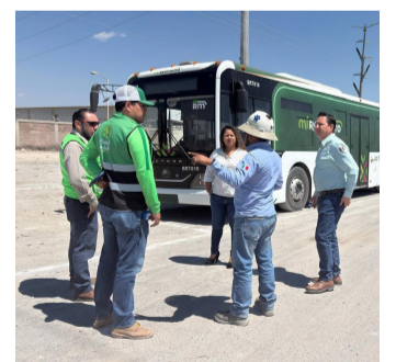
TRANSPORTE. Mejora la movilidad de los trabajadores de la zona.

La nueva estación beneficiará directamente a más de 2 mil 500 trabajadores de 11 empresas, quienes contarán con una alternativa de transporte, lo que permite optimizar los tiempos de traslado en