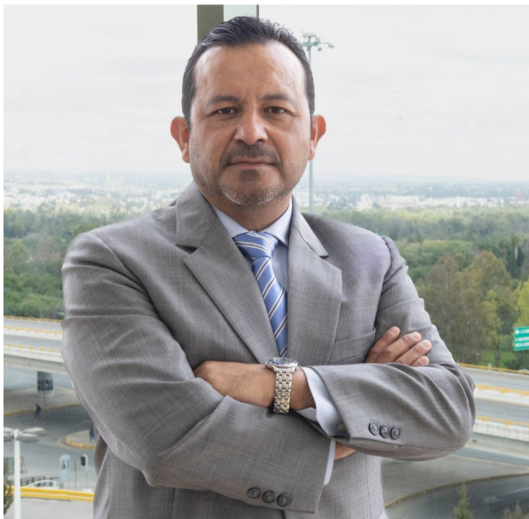
RETO. El desafío es lograr que más recursos de exportaciones se queden en SLP.

Concentra más del 71% del total de las ventas al exterior, con empresas como GM, BMW, Cummins, Bosch, Draexlmaier, Continental, ZF, BorgWarner, Valeo y Eaton.