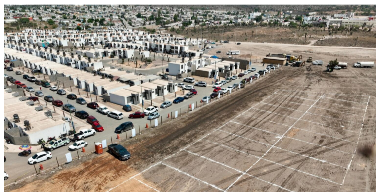
OBJETIVO. La meta es la asignación de 30 mil lotes gratuitos.

El funcionario detalló que la urbanización se desarrollará en dos frentes: por un lado, la dotación de servicios básicos como drenaje, agua potable y electrificación; y por otro,