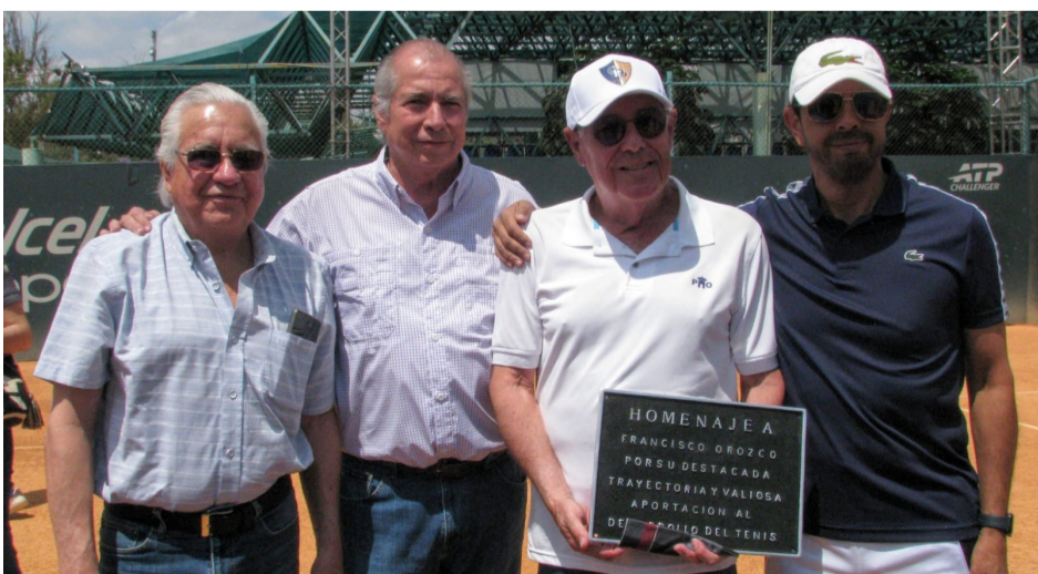
TRAYECTORIA. Años de dedicación al tenis respaldan su historia.