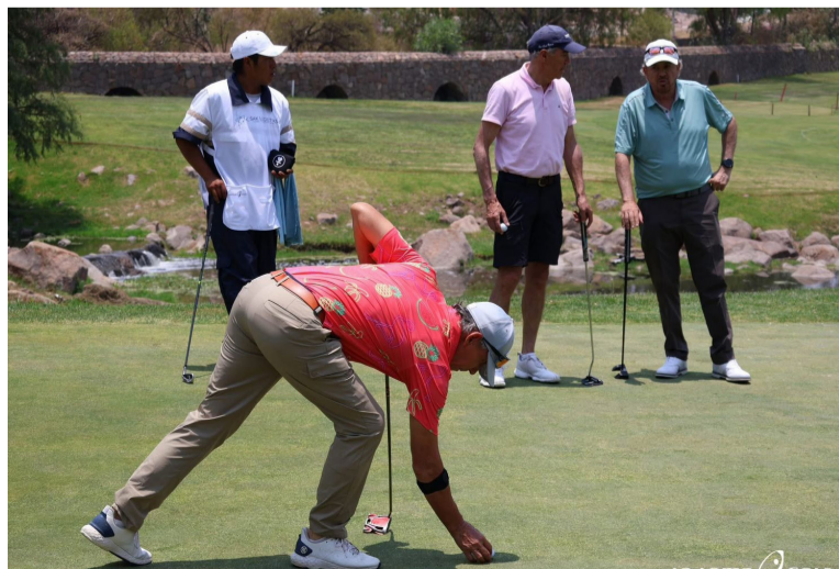
TRADICIÓN. El San Luis Open celebra su edición 17.